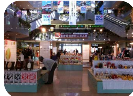
H22年10月宮崎県伝統的工芸品展 (宮崎空港ビル)