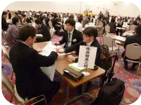
H23年2月 県産品商談会