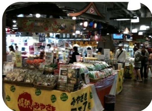
平成22年5月 台湾フェア