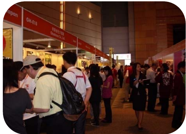
平成22年8月 香港フードエキスポ2010