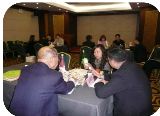
平成22年12月 中国バイヤーとの商談会(中国上海市)