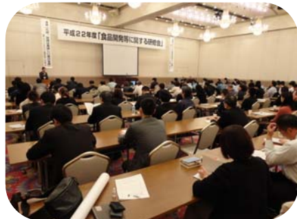
H23年3月食品開発等に関する研修会