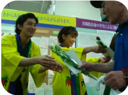
H22年9月第23回日向自慢みやざき展 (高島屋東京店)