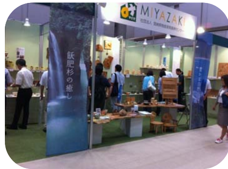
H22年9月 東京インターナショナルギフトショー