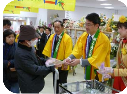
H23年2月 県産品まつり (宮崎山形屋)