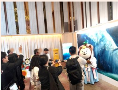
アマテラス衣装のむっちゃんが会場に登場し来場者と写真撮影

Canon Hong Kongがカメラの新商品発売にあわせ、商品購入者のみが参加できる高千穂行きの特別ツアーを来年2月に予定しています。