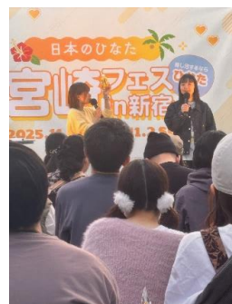
蛙亭イワクラさんのトークショー「宮崎旅のススメ」