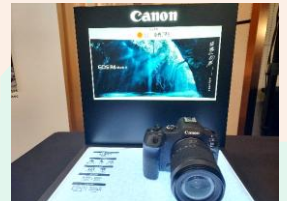
新商品と高千穂で撮影された広告