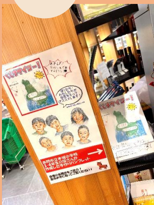
本城小学校のみなさん、素敵なパンフレットをありがとうございました！

イベント出展、テストマーケティングを随時募集中！新宿みやざき館KONNE(TEL:03-5333-7764)まで☆