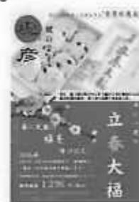
KONNEスタッフセレクト 「今月の逸品」