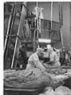
企業視察：道本食品