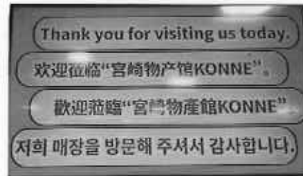
みやざき物産館の多言語動画(改訂版)

なお、みやざき物産館では、多言語動画コンテンツのリニューアル版の作成を行い、外国人観光客向け情報発信の充実を図った。