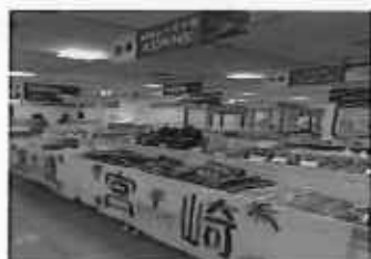
ふるさとアンテナショップフェア (そごう千葉店)