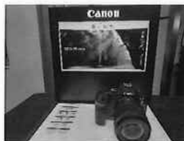
新商品発表会の様子