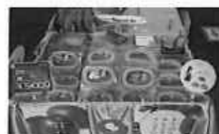
完熟マンゴーの販売