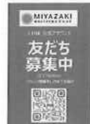
LINE公式アカウント 友だち募集 (新宿)