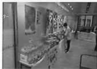
宮崎フェア (三井住友銀行本店)