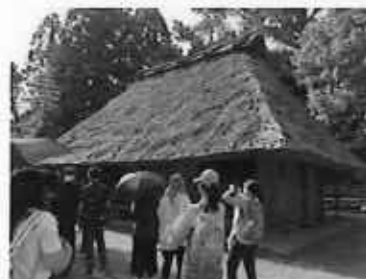
香港中文大学専進修学院の宮崎研修旅行