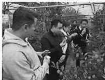
さんかんは場の視察