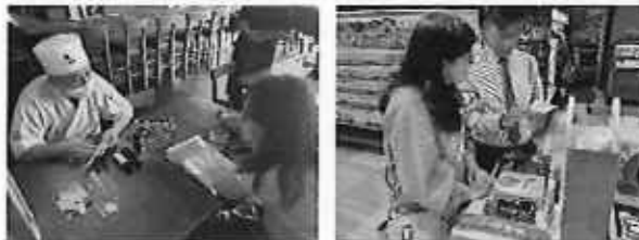
飲食店シェフや量販店バイヤーにトアリング実施

内 容： 新たに海外輸出を目指す県内事業者の加工品を香港事務所と関わりのあるサプライヤーや飲食店シェフ等に試食してもらい、商品の評価をもらった。集約した評価を県内事業者へフィードバックし、現地の声として参考にしていただいた。