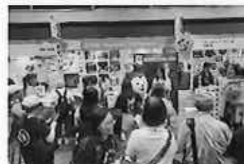
香港ホリディ&トラベルエキスポ2025秋