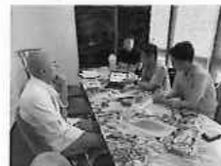
飲食店への営業活動の様子

内 容： 本県へ必ず生産者と香港卸売事業者が連携し、飲食店への同行営業を実施。香港事務所では宮崎県側との連絡調整やアテンド等で支援。