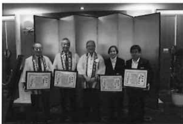
令和7年度会員表彰受賞者（4会員）