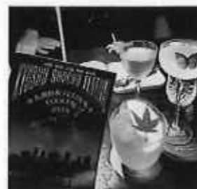
販売されたカクテル

内 容: 中国深圳市での焼酎の認知度向上を目的に、九州5県で連携し、バー3軒において各県の焼酎カクテルを販売するKyushu Shochu Festivalを開催した。