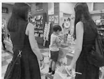
店内イベント：日向夏ジャグッチー（8月）