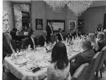
宮崎牛・都農ワインPR(American Club)