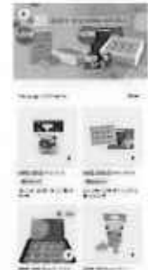
ECサイトの特設ページ

内 容： 香港EC販売大手foodpanda及び全農インターナショナル香港と連携し、県産きんかんと日向夏ネット販売を実施。バナー広告掲載によるプロモーションも行い、県産果実の認知度向上と販売促進を図った。