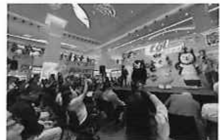
EGLトラベルカーニバル

内 容： 香港における訪日旅行最大手の旅行会社が開催したイベントにおいて、熊本県・鹿児島県と共同で観光PRブースの出展、ステージでのプロモーションを実施