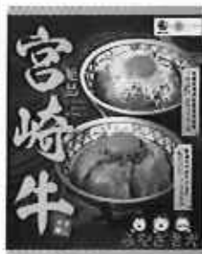
フェア特別メニュー