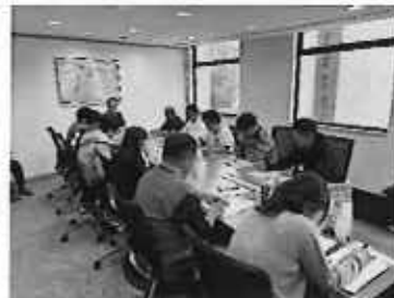
JETRO香港との意見交換