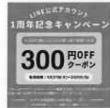
LINE公式アカウント 1周年記念キャンペーン (宮崎)

新宿みやざき館では、SNS発信の充実に加え、 令和7年11月にLINE公式アカウントを開設し、 イベントや商品情報等の発信を行った。