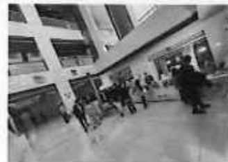
宮崎フェア (都道府県会館)