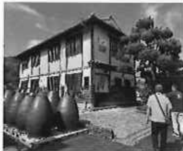
企業視察：京屋酒造