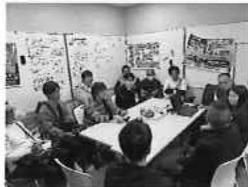
量販店の青果バイヤーとの意見交換