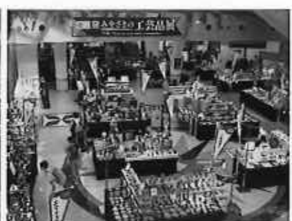
うめもんじゃ宮崎県産品まつり (宮崎山形屋)