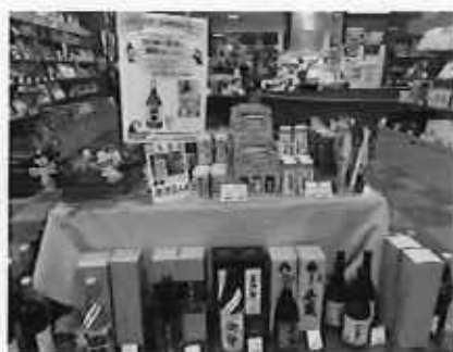
店内イベント：焼酎フェア（11月）