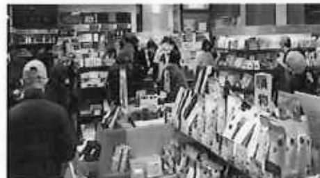
団体バス客の来店の様相