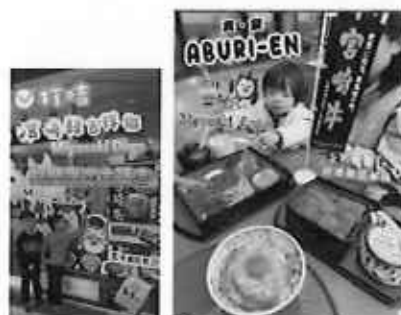
インフルエンサーSNS発