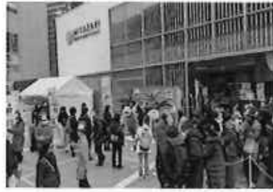
ナッシーイベント (2月)