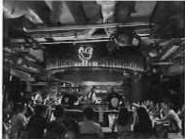
みやざき地頭鶏フェア (Birdie)