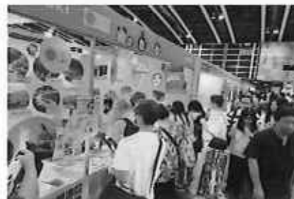
香港ブックフェア2025