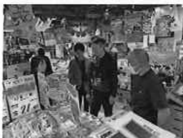
きんかん 販売状況調査

内 容： 宮崎からきんかん生産者やJA担当者が来港し、量販店青果バイヤーやJETRO香港との意見交換会及び市場調査を実施。