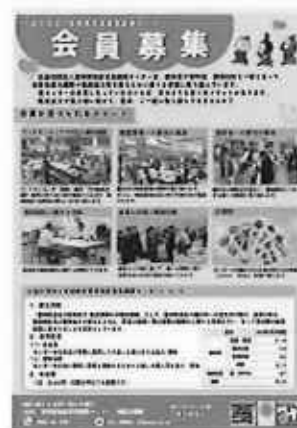
会員募集のチラシ