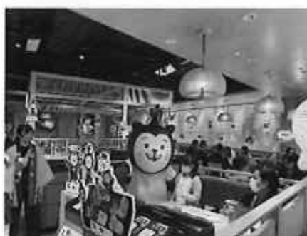
むうちゃんグリーティング