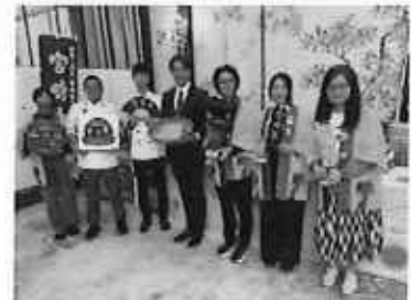
天皇誕生日祝賀レセプション