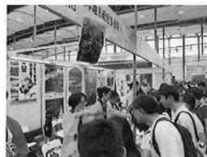
CITIE広東国際旅游博覧会の様子