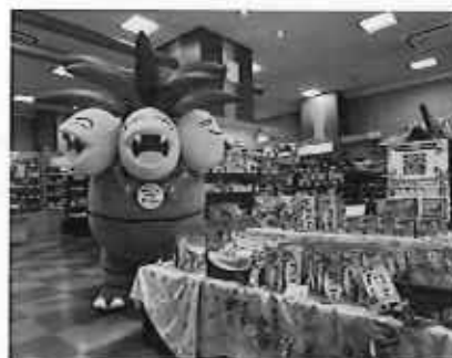
ナッシーコラボイベント（8月）

内 容：お歳暮シーズンに合わせ、「冬のギフト」フェアを実施。 店舗で4,000円（税込）以上購入毎に送料無料