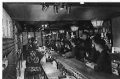
Shochu & Awamori Festival