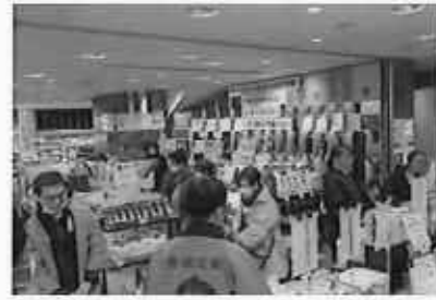
みやざき地域リレーフェア (8月～3月、計14市町村)