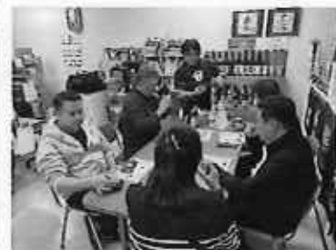
焼酎加工場の視察・試飲