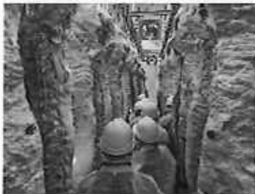
食肉処理施設の視察

内 容： 県産品の販路開拓を目的に、香港とシンガポールを中心に飲食チェーンを展開する企業の幹部5名を宮崎へ招へい。宮崎牛、水産物、青果物、焼酎等の生産現場を視察。食材の試食や生産者との意見交換、物商流構築の協議を行った。