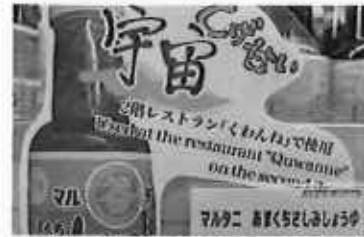
2階レストランで使用されている商品をPOPで紹介(新宿)

イ アンテナショップ発信強化イベント実施 SNSを用いた情報発信とあわせたキャンペーン、独自の企画立案によるイベントなど、アンテナショップへの誘客と県の魅力をより発揮できるようなイベントの企画運営を行った。 また、新宿については2階レストランと連携し、相互の利用客増を図る取組を実施した。